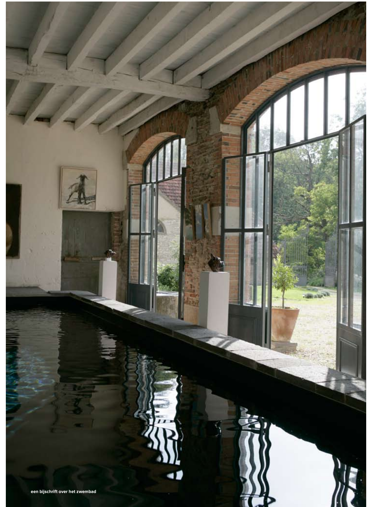
een bijschrift over het zwembad