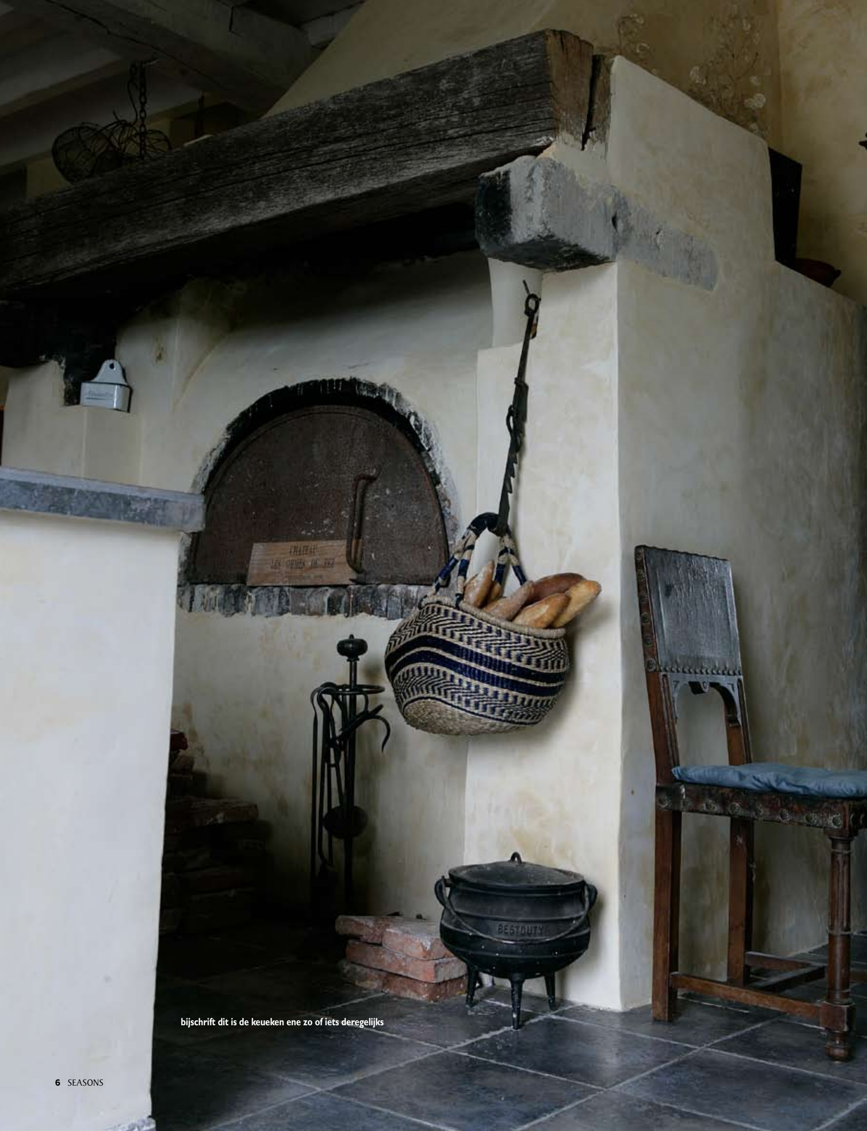
bijschrift dit is de keuken ene zo of iets deregelijks