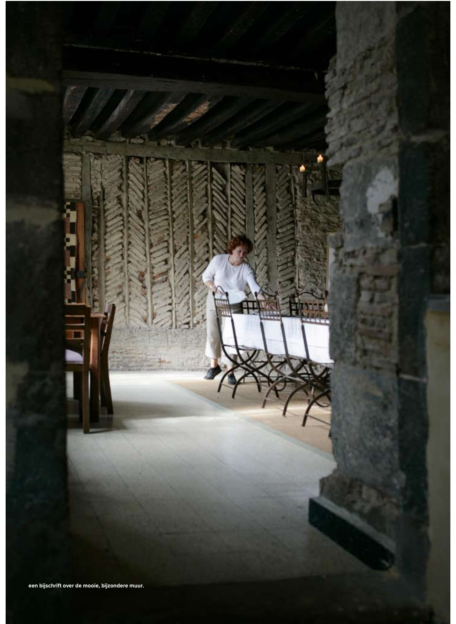
een bijschrift over de mooie, bijzondere muur.

“Nog voordat we de toegangspoort doorreden, wisten we al dat we hier zouden gaan wonen. Het klinkt misschien zweverig, maar ik had het gevoel dat het huis ons als toekomstige bewoners wilde hebben. Het heeft zich van zijn beste kant laten zien. Het grootste deel was dichtgetimmerd. Dat gedeelte van de boerderij zat al jarenlang op slot. We hebben de ruimtes met een zaklantaarn bekeken. En zelfs in dat flauwe schijnsel begonnen we meteen plannen te maken. Het was voor het eerst dat we dat spontaan tijdens een bezichtiging deden. Het voelde zo goed! We zagen het hele huis al voor ons. Wisten ook meteen waar alles moest komen: het zwembad natuurlijk in het koetshuis, de gastenkamers in de gesloten ruimte, de keuken in de hoek. ▶