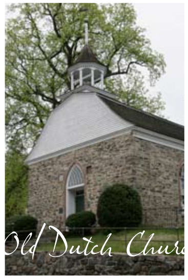
Old Dutch Church