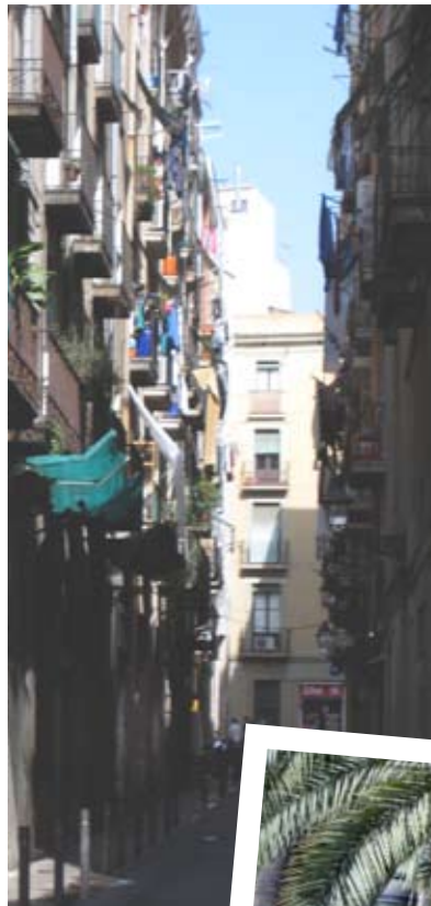
In een smalle steeg aan de kop van de Ramblas ligt de geheime toegang tot het 'Kerkhof der Vergeten Boeken'.