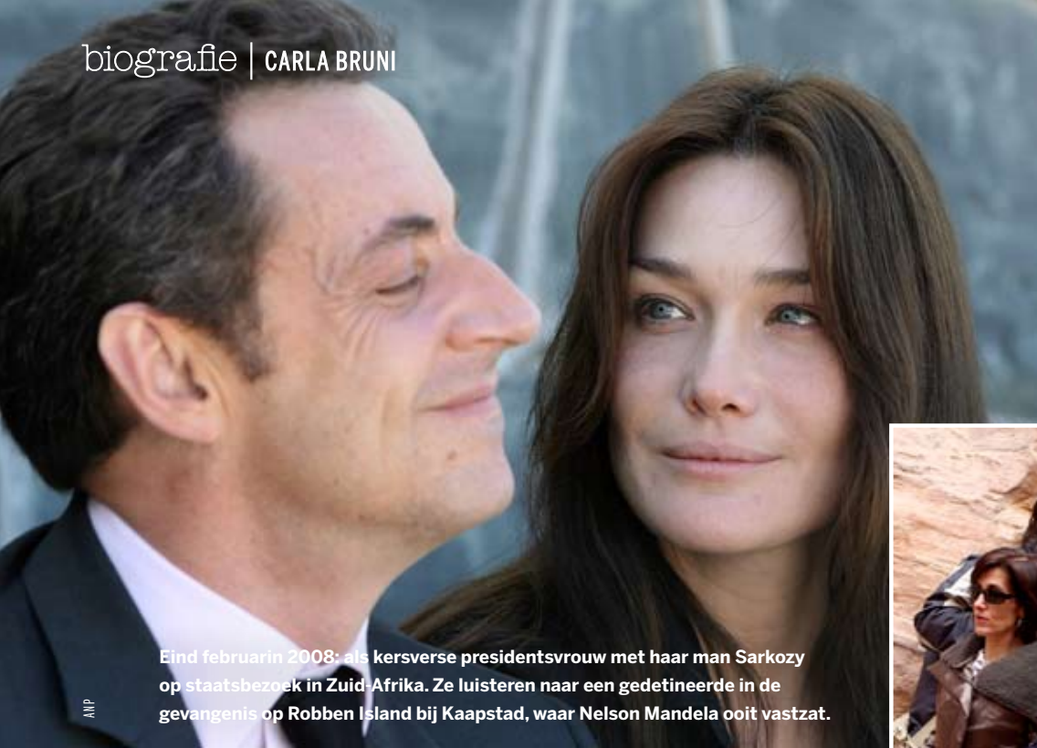
Eind februari 2008: als kersverse presidentsvrouw met haar man Sarkozy op staatsbezoek in Zuid-Afrika. Ze luisteren naar een gedetineerde in de gevangenis op Robben Island bij Kaapstad, waar Nelson Mandela ooit vastzat.