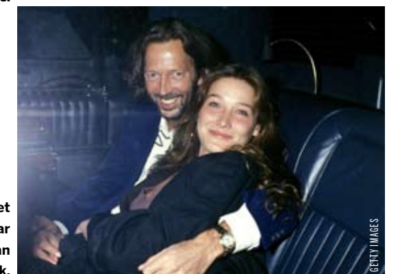
Oktober 1989: samen met lover Eric Clapton naar het verjaardagsfeestje van Bill Wyman in New York.